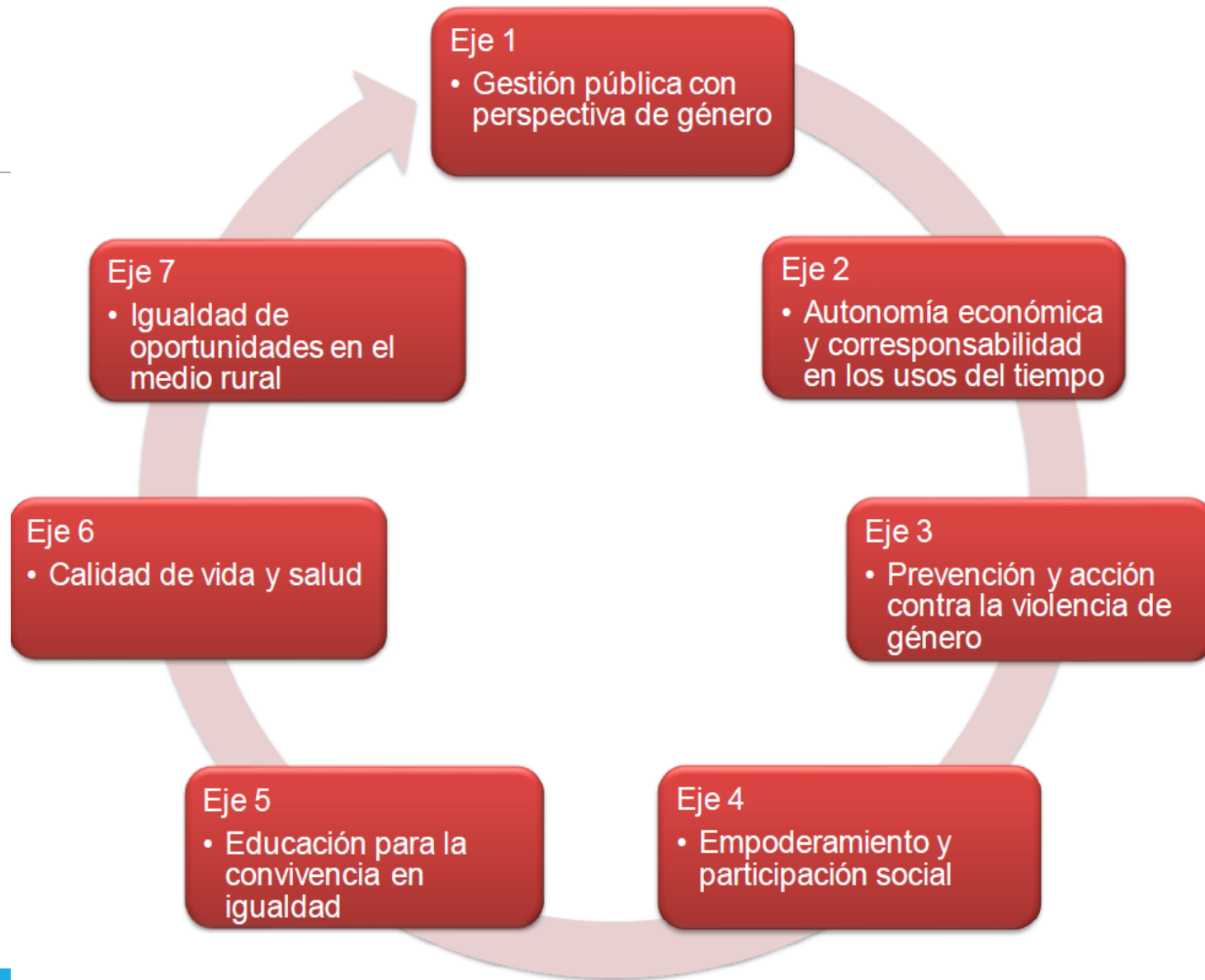
Gráfico N° 5. Ejes del PEICLM 2019-2024