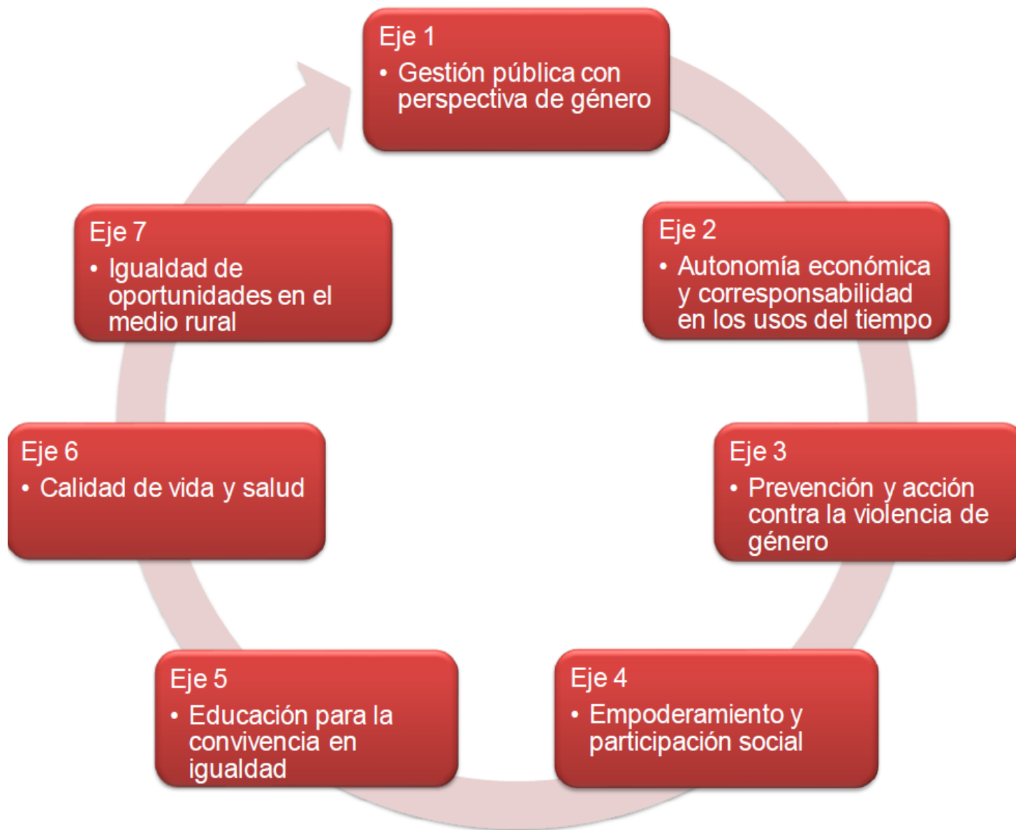
Gráfico N° 5. Ejes del PEICLM 2019-2024