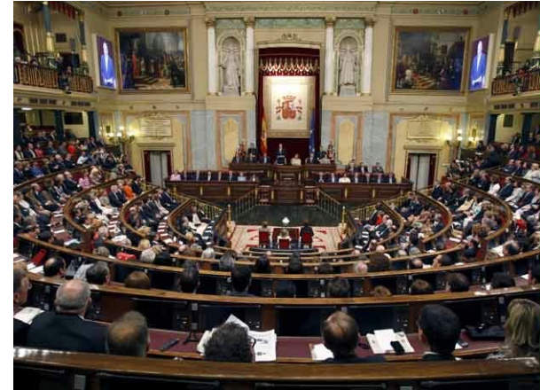
Congreso Diputados Madrid

Corresponde al Poder Legislativo, es decir, a las Cortes Generales (Congreso de los Diputados y Senado) producir las Leyes .