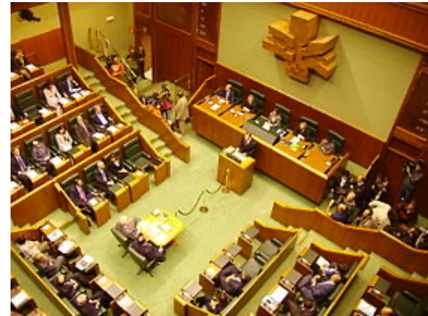
Parlamento Vasco Eusko Legebiltzarra Vitoria